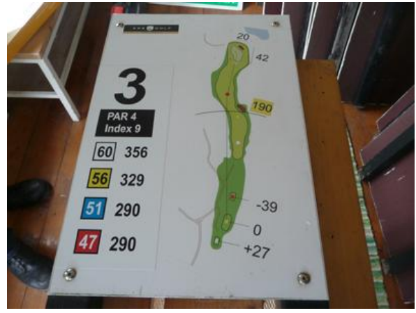
Nya håltavlorna Uudet reikätaulut