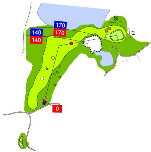
Nya håltavlor till röda utslagsplatser Uudet reikätaulut punasille uloslyöntipaikoille