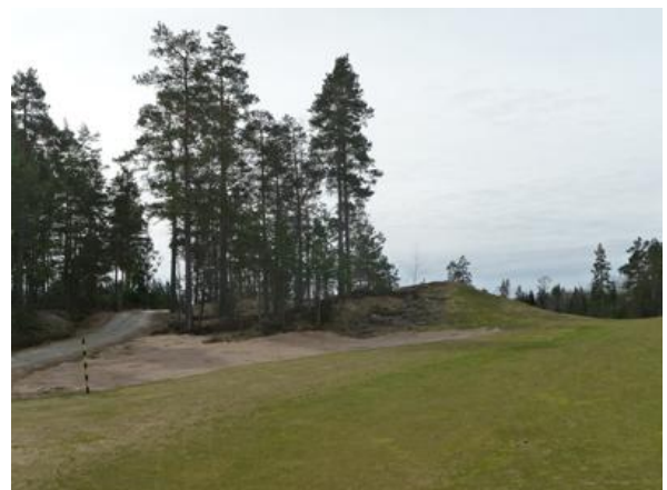
Sten borttagen på hål 2 Kivi poistettu väylällä 2